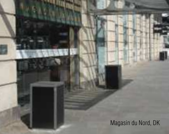
Magasin du Nord, DK