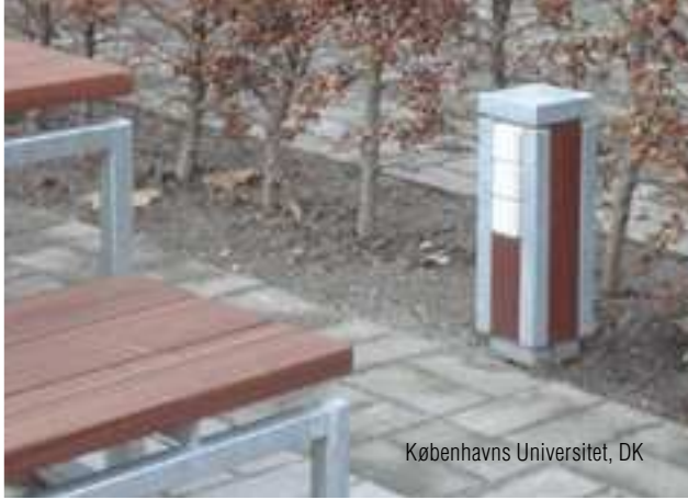
Københavns Universitet, DK