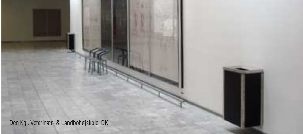
Den Kgl. Veterinær- & Landbohøjskole, DK