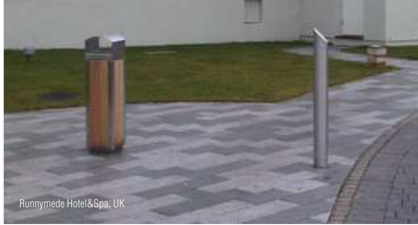
Runnymede Hotel&Spa, UK