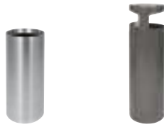
Affaldsspand eller askebæger