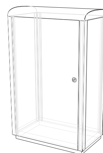
FDR L (65x40)