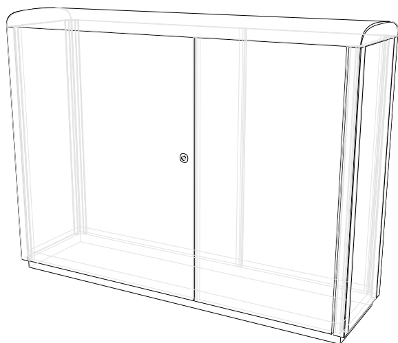
FDR XXL (142x40)

FunctionalDesign Roof er en serie af affaldspande til udendørs affaldssortering i fire forskellige størrelser. Affaldsspandene kan skræddersyes til at rumme det antal fraktioner og den affaldsvolumen som passer til individuelle behov. FunctionalDesign Roof bliver produceret i Danmark af nogle af landets dygtigste håndværkere og udført materialer af absolut højeste kvalitet, som er skabt til at stå i miljøer med hård brug.